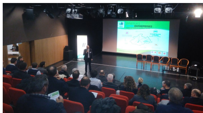
Le bureau d'étude Tehop a présenté de nombreux exemples de démarches de synergies inter-entreprises.

Les synergies inter-entreprises contribuent à augmenter la compétitivité des entreprises, en conservant de la valeur sur le territoire et en mutualisant l'utilisation des ressources.