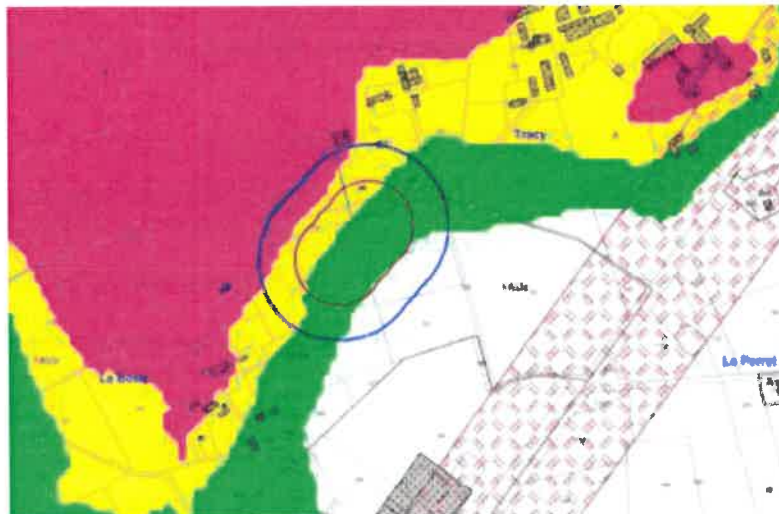
Extrait de la carte / Site « Agrigaz »