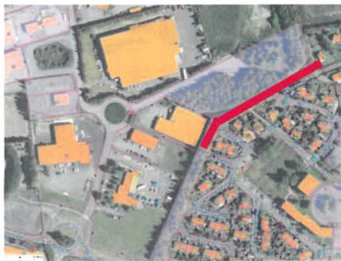
Fonds de carte Mapéo