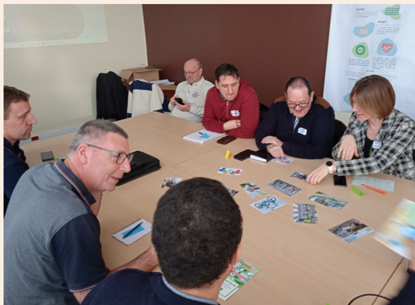
Réflexion collective sur les mobilités alternatives à la voiture individuelle