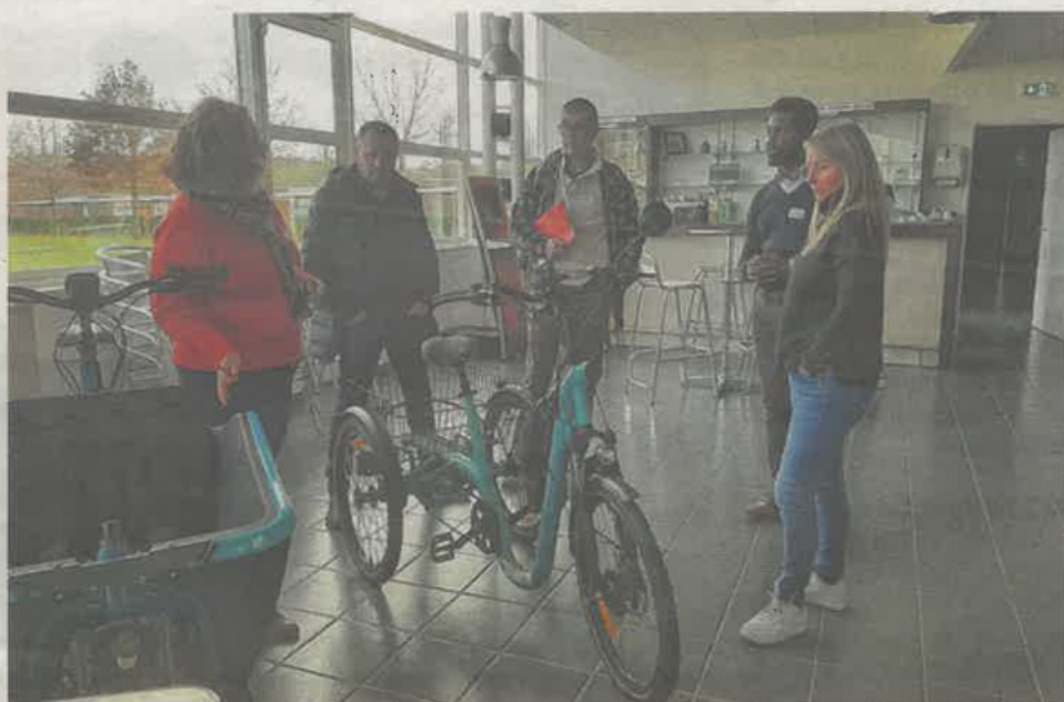
Vendredi, les CSE des entreprises inscrites ont participé à des ateliers.

Depuis un an, les actions se multiplient. Vendredi 26 janvier, l'Intercom qui a déjà rencontré les chefs d'entreprise, avait choisi de rencontrer les représentants des salariés via les CSE (comité social et économique) à l'école des pompiers de Vaudry. Au programme : des ateliers afin de réfléchir ensemble à ce qu'il est nécessaire d'améliorer pour développer la pratique du vélo. « On a déjà des retours, on sait qu'il faut encore améliorer la sécurité sur les pistes cyclables, ou encore développer les parkings et les zones de recharge pour les vélos électriques. Les entreprises