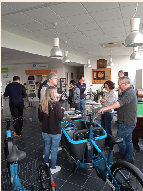
Échanges autour des vélos en exposition.